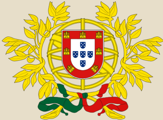
캐서린 포르투갈 공주 Queen Catherine

네덜란드 • 포르투갈 동방무역 아시아의 차가 유럽으로 유입 1598년 네덜란드 동인도회사