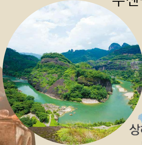
푸젠성 우이산 武夷山